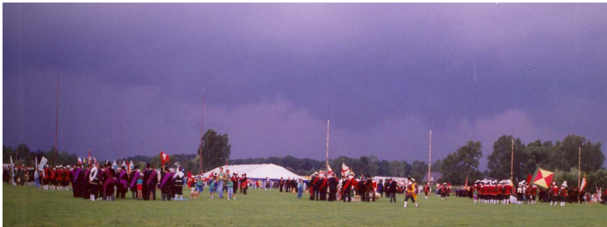
Omweer en komst. Rennen voor een draag onderkomen in de tent

Het Sint Joris Gilde leeft en heeft volop toekomstplannen. Eind 1989 werd begonnen met de opleiding van een groep bazuinblazers. Daarnaast is er in 1992 een groots opgezet gildefeest georganiseerd. Nu ter gelegenheid van het 450-jarige bestaan en gebaseerd op de juiste oprichtingsajste. Een fikse donderbui bij aanvang van de historische optocht was een kleine spelbreker. Uiteindelijk werd het gildefeest een groot succes. Elf jaar later, de agenda in 2002 was te vol, werd het 460-jarige bestaansfeest gevierd. Het was nu prochtig weer en de vernieuwingen die het gilde in de organisatie bracht worden nog steeds geprezen en hier en daar nagevolgd.