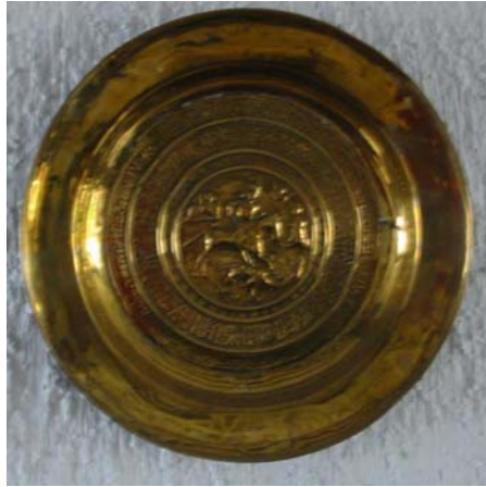
Doopschotel uit het einde van de 16e eeuw

De tijd, waarin Sint Joris geleefd moet hebben, was politiek zeer onrustig en instabiel. Regeringen volgden elkaar heel snel op en het Romeinse Rijk werd geconfronteerd met invallen. Zoals we al gezien hebben stond ook het katholieke geloof onder zware druk. De vervolgingen waren sinds de regering van Nero (54-68) niet zo hevig en wreed meer geweest. Het zal duidelijk zijn dat de leiding van de nog jonge kerk onder zware druk stond en moeilijke tijden doormaakte. Zo weten we onder meer