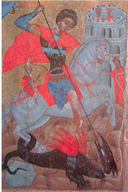
Icoon uit de kerk Sveta Bogorodica te Tarnovo in Bulgarije. 1684

Ongeveer 6 eeuwen lang werd Sint Joris vereerd zonder dat er sprake was van de draak waarmee hij nu gewoonlijk wordt voorgesteld. Het was pas in de Middeleeuwen (13de eeuw) dat dit dier ten tonele verscheen in de Legenda Sanctorum , geschreven door Jacobus da Voragine, de dominicaner aartsbischop van Genua. Dit Latijns manuscript verhaalt het leven van verschillende heiligen en werd spoedig bekend onder de naam "Legenda Aurea".