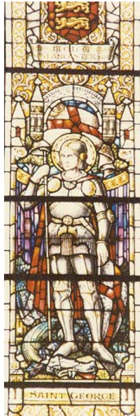
Glas-in-loodraam in de kerk van Sint Audorant in Passendale (België) Geschonken door de

De afbeelding van Sint Joris of Georgius, de drakendoder en als Romeins soldaat gezeten op een meestal wit paard, komt ons vermoedelijk allemaal bekend voor en spreekt ons ongetwijfeld tot de verbeelding. Niet alleen in de West en Noord Europese katholieke kerk is het een veelvuldig afgebeelde en aanbeden heilige, maar ook met name in de Russisch en Grieks Orthodoxe kerk wordt hij vereerd. De opmerkelijke toerist of geïnteresseerde kunstliefhebber kent hem van beelden, schilderijen en iconen, stads- en gevelversieringen, graftomben, Engelse en Russische munten en postzegels om maar iets te noemen. Wat veel minder bekend is is dat er van Sint Joris twee legenden bestaan en dat de verering van Sint Joris voor het jaar 1100 niet voorkomt. Daarmee is hij in feite een relatief jonge heilige. De ene legende gaat over Sint Joris als drakendoder en de andere over Sint Joris als martelaar. In dit artikel zijn beide legenden tot een verhaal samengevat.