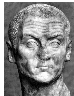
Diocletianus 284-305 na Christus