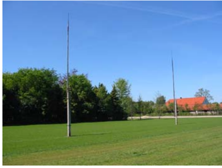
Het huidige gildeterrein aan de Heersdijk in Oirschot